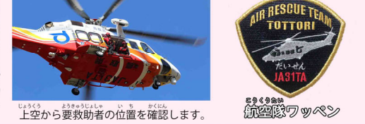
上空から要救助者の位置を確認します。