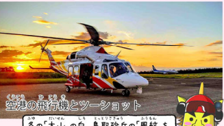
空港の飛行機とツーショット