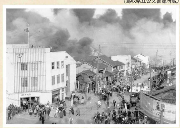
火災発生のおよそ、鳥取市街地に炎が上っています。