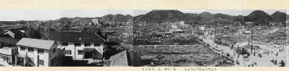
鳥取市街地の焼失状況