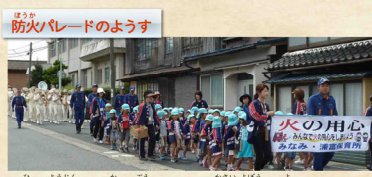
「火の用心」の掛け声のもと、火災予防を呼びかけます。