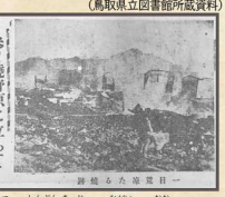
翌日の新聞記事で被害の大きさが伝わります。(鳥取新報の記事)

昭和9年6月6日午後4時40分ごろ、温泉で有名な岩美町岩井で発生した火災は、建ちならぶ温泉旅館や民家に次々と燃え広がり、全焼建物339棟、半焼19棟と岩井地区全体を焼きつくす大火となりました。岩井地区では毎年、大火が二度と起こらないよう火の用心の思いを込めて防火パレードを行っています。