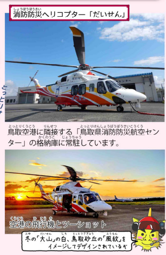
消防防災ヘリコプター「だいせん」