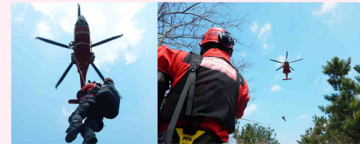
山の中で発生した救助現場。ヘリコプターから航空隊員が降りてきます。

鳥取県消防防災航空隊は、林野火災など地上から近くすることが難しい火災現場の上空から消火活動を行ったり、山や海などで発生した救助現場で救出活動を行います。また、救急車で病院に搬送するのに長時間かかる場合は、傷病者をヘリコプターに乗せて救急搬送を行います。