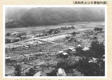
岩井地区が一面焼け野原になりました。

昭和9年6月6日午後4時40分ごろ、温泉で有名な岩美町岩井で発生した火災は、建ちならぶ温泉旅館や民家に次々と燃え広がり、全焼建物339棟、半焼19棟と岩井地区全体を焼きつくす大火となりました。岩井地区では毎年、大火が二度と起こらないよう火の用心の思いを込めて防火パレードを行っています。